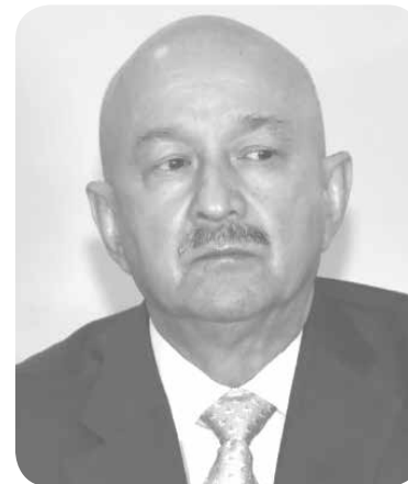
Carlos Salinas de Gortari

Yvaya que desde la ex gran Tenochtitlán, se vino desde hace días, una propagación de influencia política en un radio de acción que abarca hasta Sonora. Tiene que ver con las definiciones que vienen en el mediano plazo.