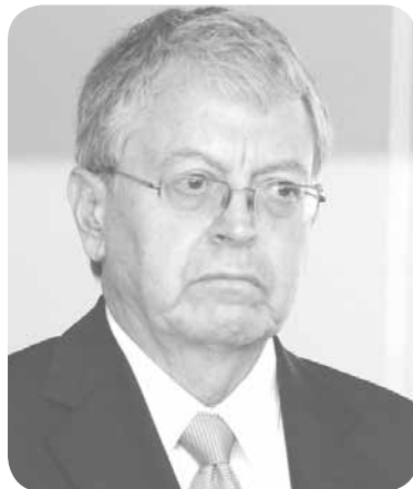
Manuel Camacho Solís