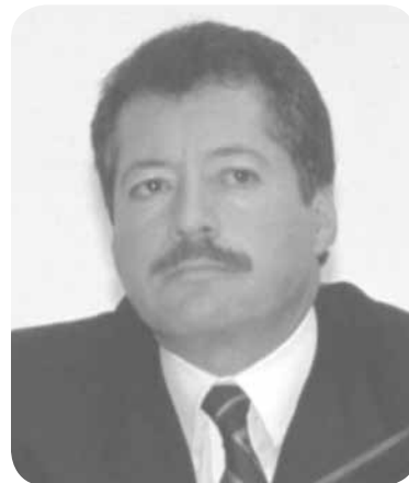
Luis Donald Colosio