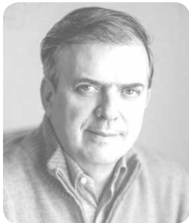
Marcelo Luis Ebrard Casaubon